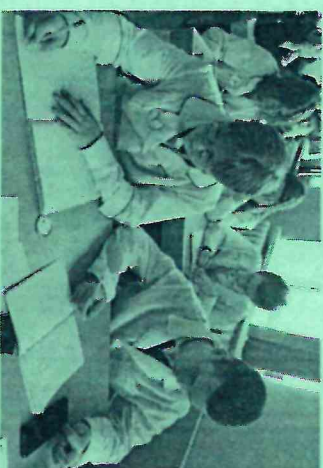
Темы мастер-классов от обучающихся 10 А профильного медицинского класса